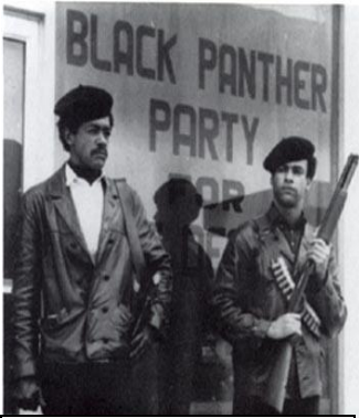
(Local du Black Panther Party (for self-defense), 1966)

Aux États-Unis, les années 1960 ont été à bien des égards très contestataires. La création de la SNCC (Student Nonviolent Coordinating Committee) en 1960 contre l'intervention de l'armée américaine dans le monde s'est transformée dans les années suivantes en lutte ouverte contre la guerre du Vietnam. Le SDS (Students for a Democratic Society) formé en 1962 combiné au FSM (Free Speech Mouvement) de Berkeley en Californie va prendre des proportions importantes en luttant pour la démocratisation des écoles et de la société. On assiste à plusieurs importantes manifestations et à des occupations d'universités notamment en 1967 et en 1968. La lutte que mène les afro-américain-e-s prend aussi de l'ampleur et tend à rejoindre la lutte et les perspectives prolétariennes notamment avec le Black Panther Party créée en 1966.