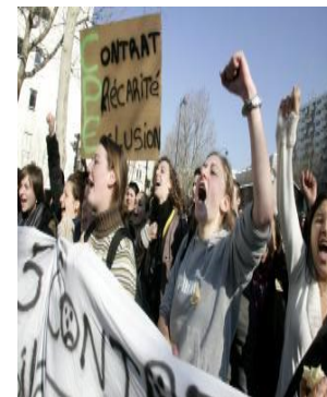
Manifestation étudiante en France contre le contrat de première embauche (CPE)

Sans travail politique révolutionnaire indépendant – nous entendons par là affranchi des structures associatives multiclassistes, pratiqué sur des bases révolutionnaires explicites et non seulement syndicales –, le syndicalisme étudiant, même « de combat », devient vite un plafond dans le processus de radicalisation. D'une part, c'est un mouvement fortement marqué par les cycles, les flux et reflux de mobilisation et de combativité, le renouvellement de ses membres. Il semble