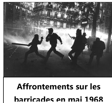
Affrontements sur les barricades en mai 1968

En Allemagne, dans la foulée du Mai 68 français, la SDS (Union allemande des Étudiants Socialistes) s'active et se radicalise. De violentes occupations d'universités, des manifestations anti-guerre et contre la réduction des droits civils seront menées en 1966, 1967 et 1968.